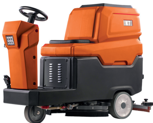
K7R560 K7R560 Li