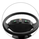
Элементы управления на руле