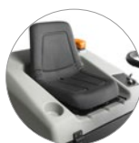
Удобное и регулируемое сиденье