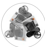
Манёвренная и компактная: радиус разворота всего в 190 см