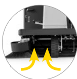
Всасывание на боковой щётке