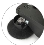
Кронштейн для левой боковой щётки (опция)